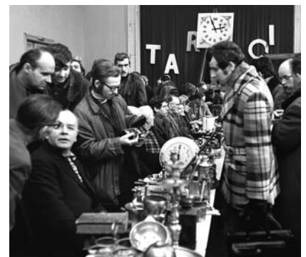
Pierwsze targi staroci zorganizowane w sali widowiskowej Domu Narodowego.

Cieszyński Klub Hobbystów wniósł także walny wkład w powołanie do życia Polskiej Federacji Organizacji Kolekcjonerskich, która 21 czerwca