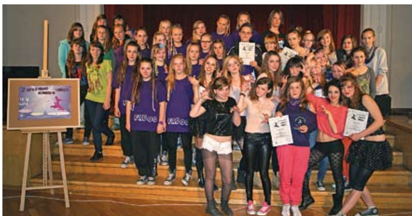
Laureaci II Cieszyńskiego Konkursu Tańca zaprezentują się podczas Święta Trzech Braci.