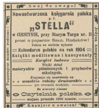
Nowo założona księgarnia „Stella” reklamowała swą ofertę na łamach wielu polskich czasopism, na czele z „Gwiazdką Cieszyńską”.