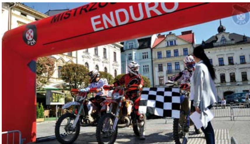
W Cieszynie zorganizowano III i IV rundę Mistrzostw Polski i Pucharu Polski rajdów motocyklowych Enduro

Pierwotnie zawody zaplanowane były w Opolu, ale niestety organizator zmuszony był je odwołać z powodu braku wsparcia ze strony lokalnych władz. Organizator zawodów, Cieszyński Klub Motorowy, podjął się wyzwania przeprowadzenia zawodów w trybie awaryjnym – w trzy tygodnie i wywiązał się z tego zadania celująco. Podkreślić należy dużą przychylność i zaangażowanie władz miasta Cieszyna, które na bazę rajdu udostępniły przepiękny rynek miasta. Niektórzy mogą narzekać, że odcinki dojazdowe prowadziły głównie drogami utwardzonymi, ale za to próby stanowiły swoisty majstersztyk i prawdziwą esencję Enduro. Organizator przygotował aż cztery próby sportowe, każda o zupełnie innej specyfice. Próba cross została zlokalizowana na torze motocrossowym w Cieszynie, który właśnie przeszedł gruntowną modernizację dzięki środkom pozyskanym przez CKM z dotacji unijnej. Próba Xtreme prowadziła przez bardzo ciężki, górzysty teren i zawierała sztuczne przeszkody jak opony czy belki drzew. Próba Enduro A zorganizowa-