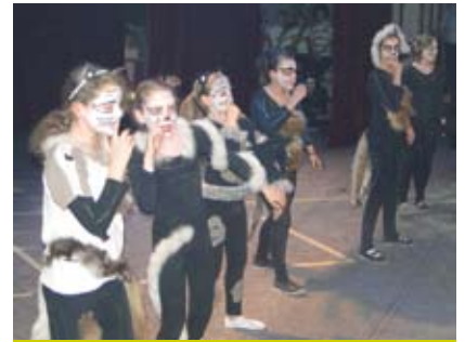
W przeglądzie „Szkolna Ławka Artystyczna” brali udział uczniowie szkół podstawowych i gimnazjów.

Szczególne podziękowania należą się wszystkim młodym artystom oraz ich opiekunom, którzy nie zawiedli w