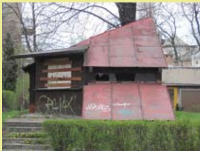
Nieruchomość przeznaczona do dzierżawy na skrzyżowaniu ul. Bielskiej i ul. Wyższa Brama.

Burmistrz Miasta Cieszyna ogłasza ustny przetarg nieograniczony na wydzierżawienie na cel handlowo-usługowy nieruchomości Gminy Cieszyn.