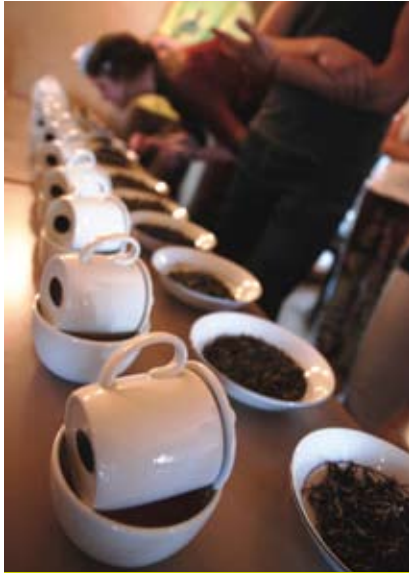
Degustacja herbat, orientalne potrawy, akcesoria herbaciane i wiele innych - to wszystko znajdzie się na festiwalu.