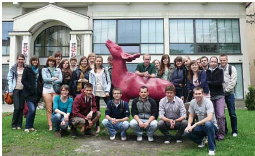
Zamek Cieszyn odwiedzili studenci SGGW.

Punktem wyjścia było kilka kwestii m.in. polsko-czeskie kontakty, wieloreligijność i multikulturowość Cieszyna. Przyjrzeni się także budynkowi Strażnicy i Wzgórzu Zamkowemu jako miejscom, które nie wykorzystują swojego potencjału. Jak rozwiązać ten problem? Studenci wyruszyli w teren, by zapytać o to mieszkańców Cieszyna i Czeskiego Cieszyna. Wprawdzie trudno przeprowadzić w ciągu niecałych dwóch dni rzetelne badania, ale udało im się zebrać kilkadziesiąt opinii na interesujące ich tematy. Wynika z nich m.in. że polsko-czeskie relacje układają się poprawnie, ale kontakty te są dosyć powierzchowne i są nawiązywane często na stopie zawodowej. Dlatego też studenci zaproponowali, by w budynku Strażnicy stworzyć kawiarenkę „Przystanek Kultura”, która miałaby być atrakcyjnym miejscem spotkań mieszkańców obu miast. Inna grupa zaproponowała, by powstała tu klubokawiarnia „Bez granic” stylizowana na przejście graniczne. W ten sposób przypominałoby się z przymrużeniem oka historię, a zarazem byłaby to kolejna atrakcja turystyczna na szlaku wędrówek wielu tury-